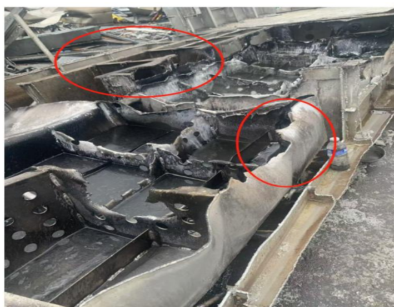
图 3：现场切割折断痕迹