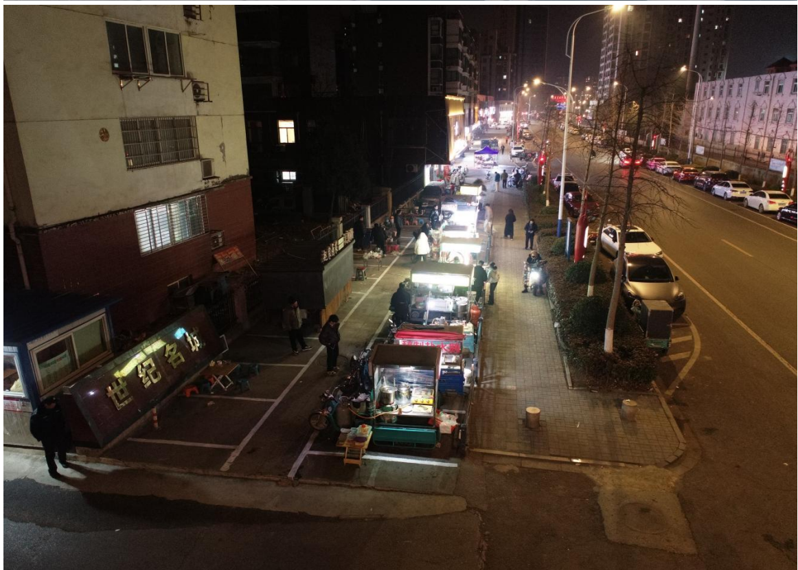
(上图为：世纪名城疏导点示意图)