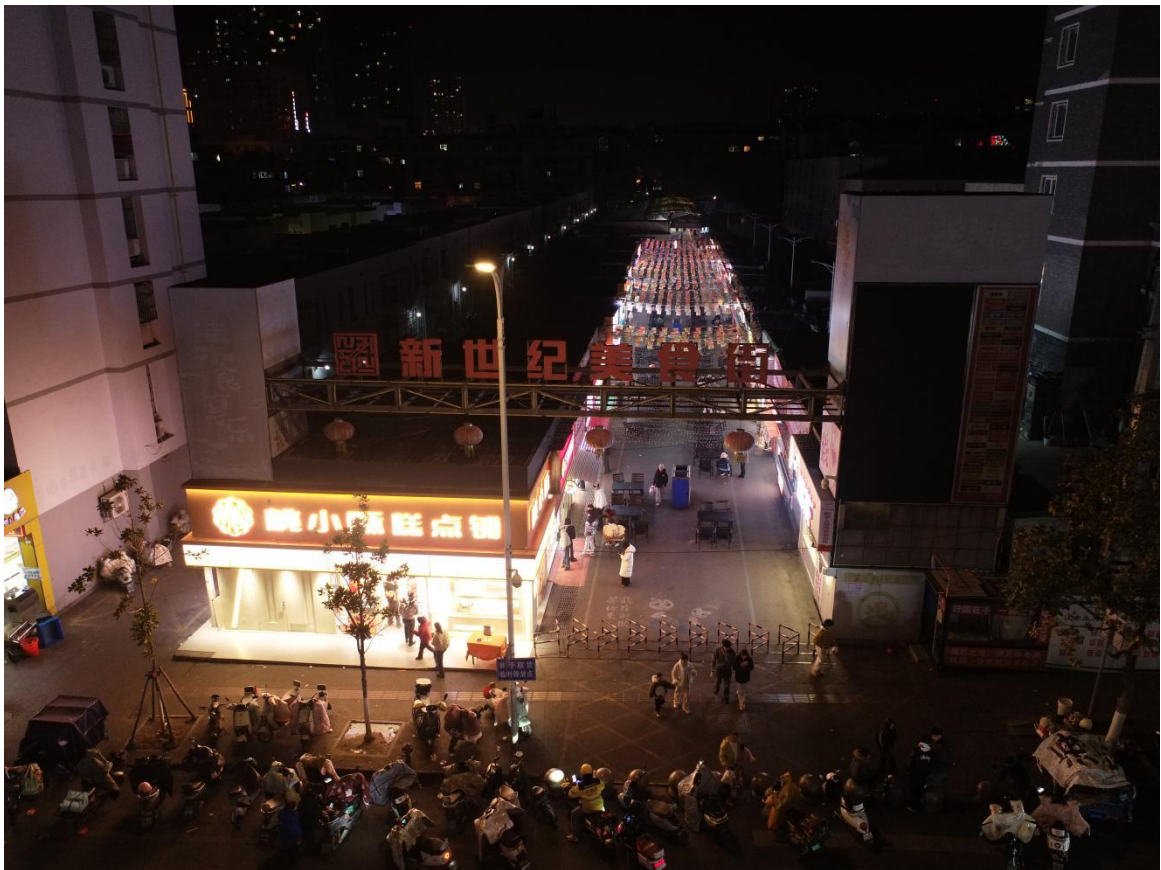
(上图为：新世纪美食街疏导点示意图)