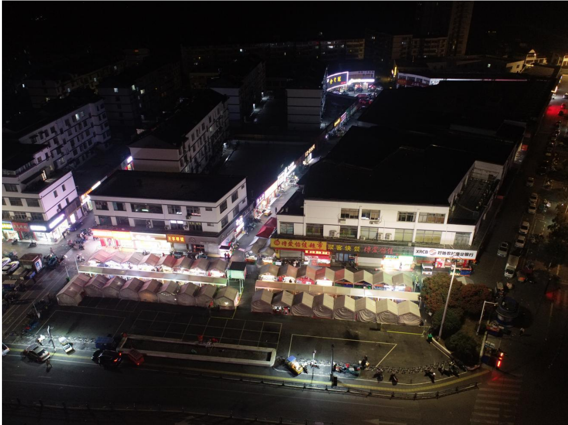
(上图为：商贸中心疏导点示意图)